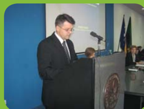
OBILJEŽEN DAN RUDARA