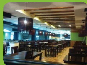
REKONSTRUIRAN 2. SPRAT RK "OMEGA" ŽIVINICE