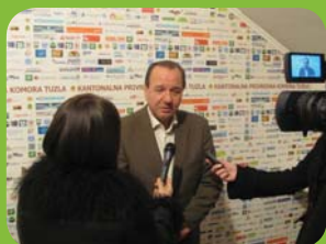
NACRT ZAKONA O ENERGETSKOJ EFIKASNOSTI U FBiH