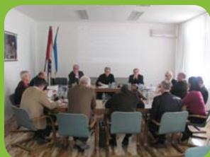
ODRŽANE REDOVNE SJED- NICE SKUPŠTINE I UO KOMORE