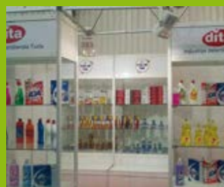
NOVE ‘GRANICE’ U BIH: ‘DITA’ MOŽE U EVROPU, ALI NE I U RS