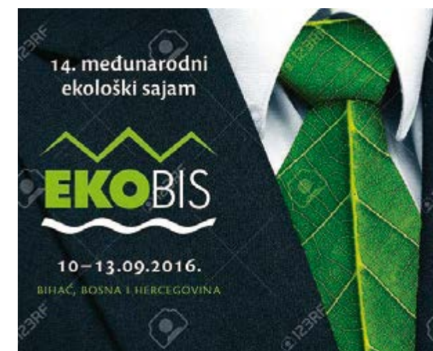
Zahvala partnerima, izlagačima i sponzorima 14. Međunarodnog ekološkog sajma EKOBIS 2016.

više sportskih klubova i prezentiralo različite vrste sportova: nogometa, košarke, košarke za invalidne osobe itd. Posebnu atrakciju predstavljala je i proizvodnja prirodne rakije na tradicionalni način, a koju je demonstriralo seosko domaćinstvo „Neron“ Bihać, a osim toga, sajamske dane je uveseljavalo gostovanje vrsnih bihaćkih muzičara na samim štandovima. U večernjim satima, prva večer bila je namijenjena partnerima, pokroviteljima i sponzorima sajma, drugu je obilježila Muzička noć sajma "EKOBIS 2016" koja je održana na centralnom gradskom trgu u Bihaću i u kojoj su mogli uživati svi poklonici pop i rock muzike, a treću noć bila je rezervirana za visoko vrijedno dokumentarno filmsko ostvarenje – naučno – promotivni film Nacionalnog parka „Una“ „Tragom medvjeda zvanog Ljutoč“ čija projekcija je održana u Cinestaru u Bihaću. Raznovrsnim sadržajima Direkcija sajma „EKOBIS 2016“ nastojala je i ove godine udovoljiti svim generacijama i interesima, a posjetiocima preostaje samo da izaberu one njima najinteresantnije.