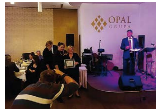
"Zanimljivosti za posjetioce sajma „Ekobis 2016“

Mnogobrojne atrakcije pripremljene su za ovogodišnje posjetioce sajma – od samog ulaza na sajmište i prezentacije vjetro-turbine „VVT SAF“ – inovacije porodice Ferizović, slikarske izložbe Fondacije Centra Duga Art, Dječjih ekoloških radionica koje su obilovati ekološkim aktivnostima i na maštovit način pokazivale kako izraditi različite upotrebne predmete od recikliranog otpada, čepova odbačenih sa boca, izrada eko predmeta i eko suvenira od prirodnih eko-materijala, različitih ukrasa, bile su naročito zanimljivi učeničkoj, ali i onoj malo starijoj populaciji, jer učenje je cjeloživotni proces. Mališani su imali priliku korisiti igraonicu na vanjskom izložbenom prostoru ŠPD „Unsko-sanske šume“ i zanimljivosti s animatorima koje je za njih organizirala „Bihaćka pivovara“ d.d. Bihać. „Bihaćka pivovara“ d.d. Bihać imala je prezentacije svojeg proizvodnog programa čak sva tri sajamska dana, a svoje proizvode predstavili su i „Kolmix“ d.o.o. Velika Kladuša, koji je organizirao i degustacije svojih juha za posjetitelje. Za žensku populaciju, posjetiteljice koje su željele isprobati ljekovitu šećernu pastu za depilaciju, imale su sreću ili sudjelovati u njoj ili vidjeti njenu praktičnu primjenu na štandu „Magic Touch“. Za ljubitelje sporta Sportski savez grada Bihaća prezentirao je aktivnosti sportskih klubova svojih članica, u kojima je sudjelovalo