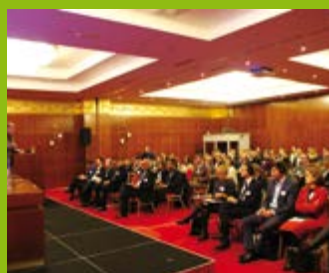
“AKTUELNI IZAZOVI ZA LOKALNU PRIVREDU”