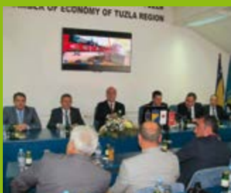
MOGUĆNOST INVESTIRANJA I ŠIRENJA POSLOVNIH IDEJA