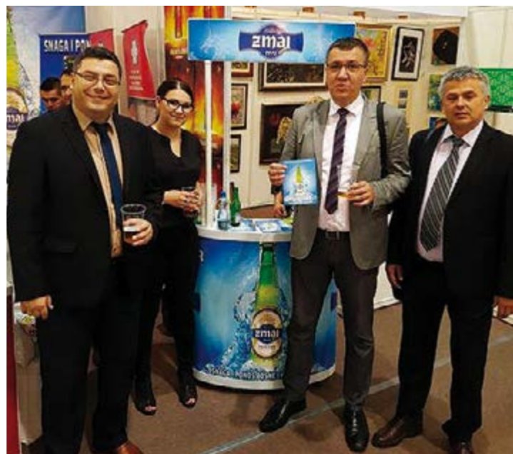
Novo priznanje za "Kreativa marketing" za „Zmaj“ pivo

Sajamsku ekspediciju pod nazivom "Privreda TK" a koju je predvodila i organizovala Kantonalna privredna komora Tuzla, ove godine su u Bihaću sačinjavali: "Fana" d.o.o. Srebrenik, Piemonte Tuzla, "Solana" d.d. Tuzla, "Porta Naturae" d.o.o. Srebrenik, Voćni rasadnik doo Srebrenik, Fabrika deterdženata „Dita“ Tuzla, „Borplastika Eko“ Tuzla, "Imel" doo Lukavac, "Corn Flips" Srebrenik, Turistička agencija "Golden tours" Tuzla, "Xella BH" d.o.o. Tuzla, "JKP "Pannonica" doo Tuzla, "Kreativa marketing" Tuzla, OPG „Veselić“ Špionica, "Gizmo" doo Tuzla, "Pivara" dd Tuzla, Turistička zajednica TK, "GiKiL" doo Lukavac, "TQM" doo Lukavac, "Sparkasse" Bank PJ Tuzla.