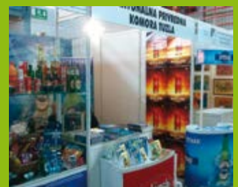
“PRIVREDA TK” NA ZNAČAJNIM SAJAMSKIM MANIFESTACIJAMA