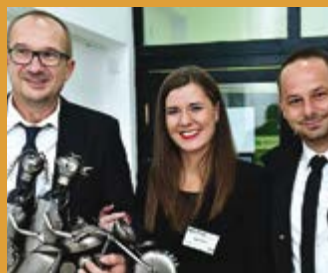
PROSLAVA 20 GODINA POSTOJANJA I USPJEŠNOG DOPRINOSA ZAŠTITI OKOLIŠA