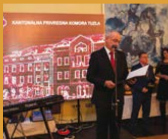
OBILJEŽEN JUBILEJ: 115 GODINA KOMORE