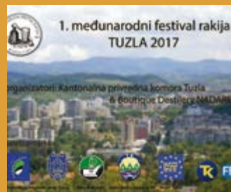
„1. MEĐUNARODNI FESTIVAL RAKIJA TUZLA 2017“