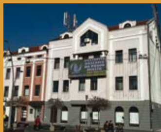
LED DISPLAY NA ZGRADI KOMORE - NOVA USLUGA ČLANICAMA I FIRMAMA U TK