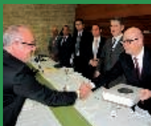
SASTANAK TURSKE DELEGACIJE I PRIVREDNIKA SA PODRUČJA TK