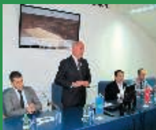
POSJETA PRIVREDNIKA REGIJE CANAKKALE TUZLANSKOM KANTONU