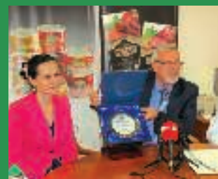
“STVARATELJI ZA STOLJEĆA”