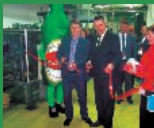
NOVI POGON – NOVA NAGRADNA IGRA