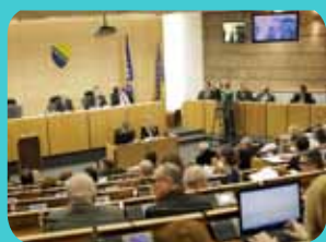
USVOJEN ZAKON O RADU