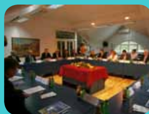
RADNI SASTANAK 7 PREMIJERA SA PODRUČJA FBiH